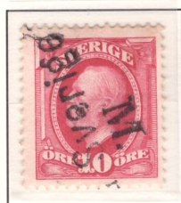
Dansk stämpel Fra Sverige M, om- vänt M (nyans e 1 )