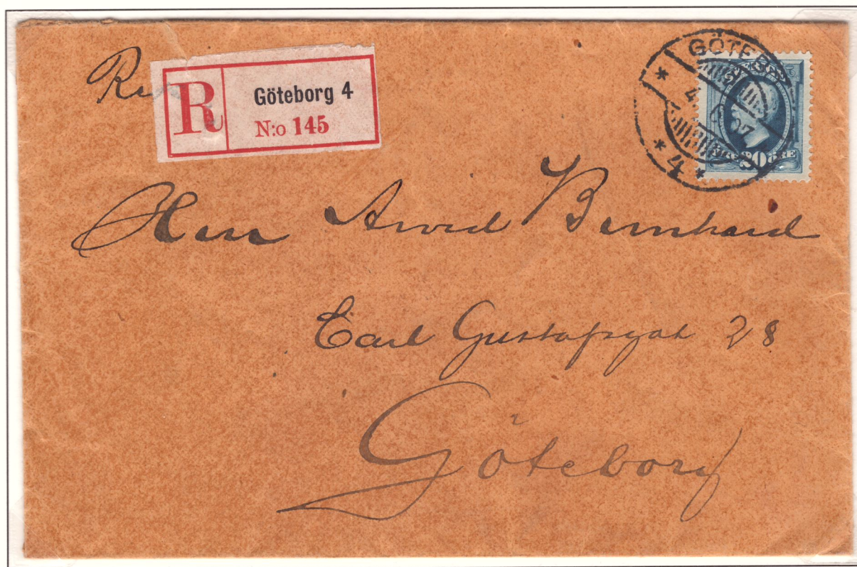
Portosats 20 öre (lägsta viktclassen, från 1/7 1905). Avsant Göteborg 4 4/6 1907.