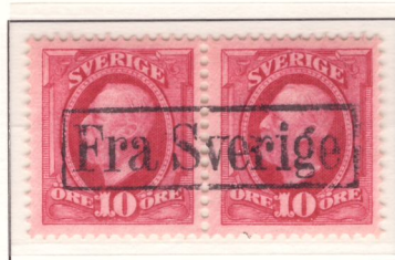
Dansk stämpel Fra Sverige (nyans e 2 )