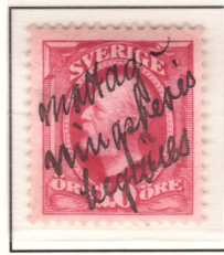
”mottagningsbevis begäres” (nyans e 1 )