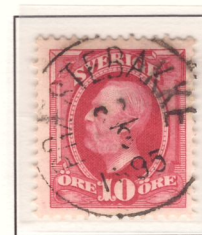
Norsk ortsstämpel Praestebakke (nyans e 1 )