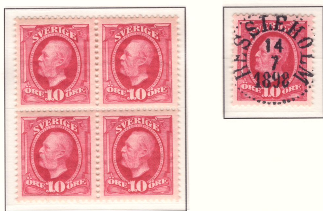
Nyans e 2 : rödaktigt karmin - rödkarmin (1897-1911)