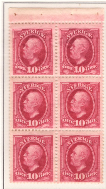
Block ur häfte, med inhäftningsremsa

Häften med 10 öre såldes under samma period som häftena med 5 öre, från 12/4 1904 till 13/12 1914. Även 10-öreshäften innehöll 30 märken, och såldes först med ett påslag på 5 öre som sedermera togs bort. Den totala upplagan var 145.609 häften.