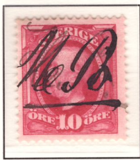
”MB” (nyans e 2 )