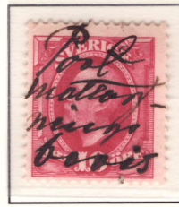
”Postmottagnings- bevis” (nyans e 1 )