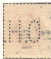
Skyddsperforering, O. H. (AB Oskar Hallberg, Örebro)