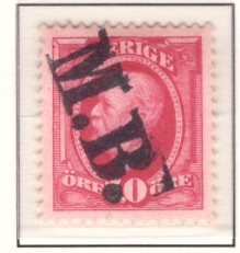
Stämpel M. B. (nyans e 2 )

Mottagningsbevis. Enligt instruktioner på postala blanketter skulle det frimärke som utgjorde kvitto på betalt mottagningsbevis makuleras för hand, med ”Mottagningsbevis begärdt” eller liknande. Stämplor med texten ”M.B.” eller ”Mottagningsbevis”, med eller utan ram, har också använts.