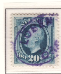
"LÖSEN ... ÖRE"