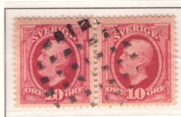
Finsk figurstämpel (Raumo)