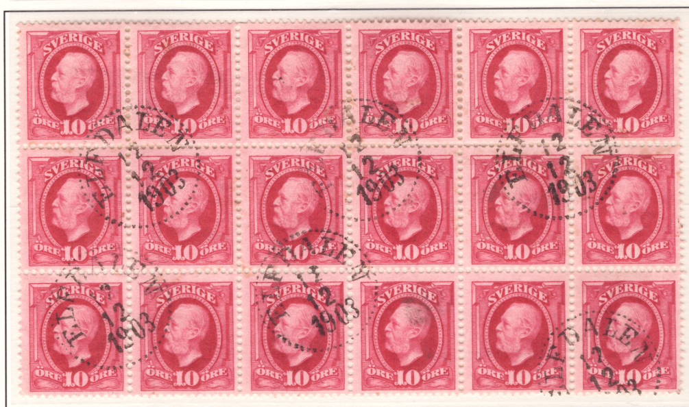
Nyans e 2 i 18-block avstämplat Elfdalen 12/12 1903.