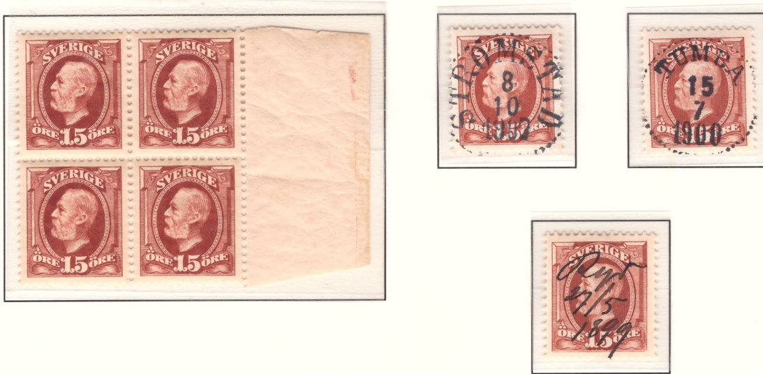
Handskriven makulering Ryd