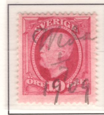
Handskriven makulering Weda