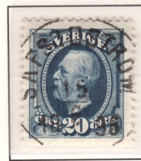
Klar ultramarinblå Matt ultramarinblå