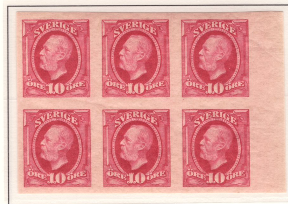
Normalprov, nyans e 1