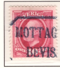
Stämpel ”Mottagningsbevis” (nyans e 2 )