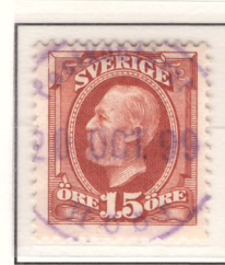
Blå stämpel Stockholm Söd