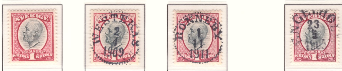
Nyans c: Violettaktigt karmin och grå (1903-05)