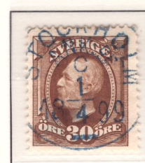
Blå stämpel, Stockholm Ank.