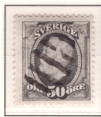
Figurstämpel (troligen finsk)