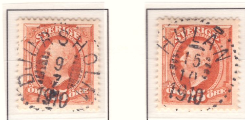
Nyans e: matt brunorange (1909-11)